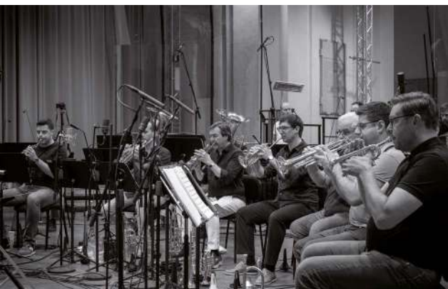
The Philharmonic Brass