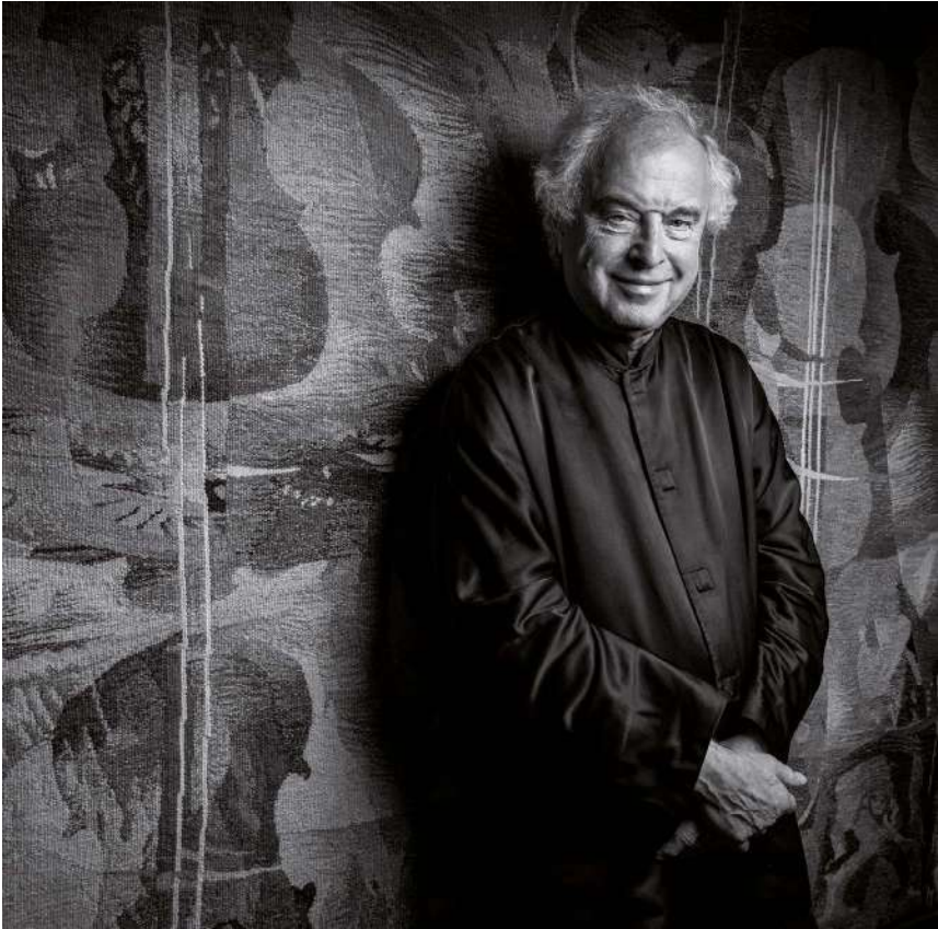
Sir Andrés Schiff