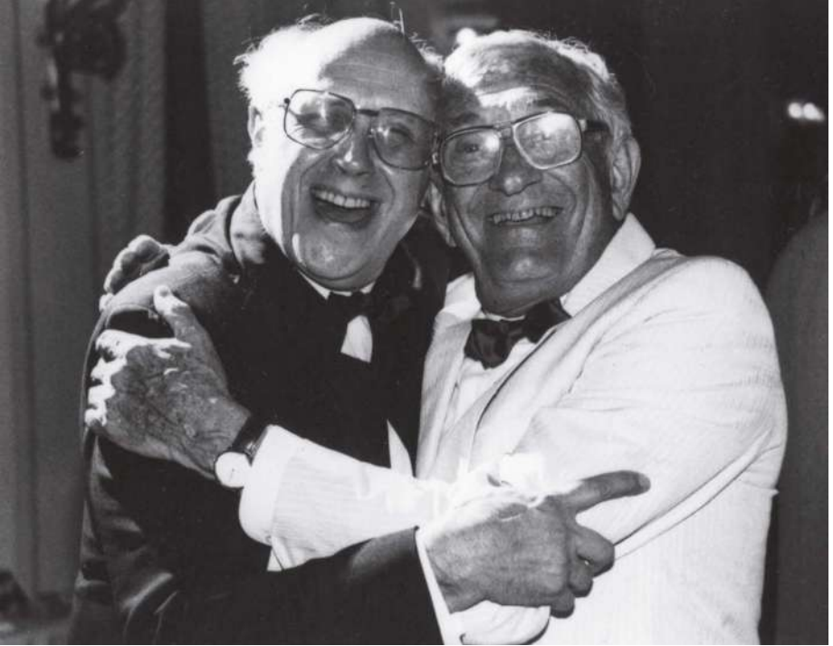
Mstislav Rostropovich et Antoine Riboud